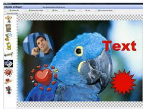
Obiettivi del corso

Adobe Photoshop è il programma di elaborazione grafica utilizzato da professionisti ed aziende per creare e modificare immagini, per creazioni artistiche e per elaborare foto digitali. Imparare ad usare con competenza Photoshop consente di impadronirsi del più efficace e diffuso strumento per la grafica digitale attualmente disponibile. Il corso base di Photoshop consentirà l'apprendimento delle operazioni fondamentali, l'uso degli strumenti e delle funzioni principali del software dell'Adobe. L'aspetto teorico necessario a comprendere le fondamenta della computer grafica si affiancherà ad esercitazioni di composizione e fotoritocco.